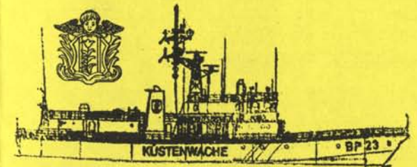
Bundespolizei-Patrouillenboot BP 23 „BAD DÜBEN“

Am 01.07.2005 wird der BGS per Gesetz Bundespolizei.